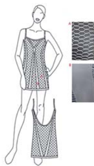
一體成型高針密精品 性感內衣設計(圖1)

本計畫執行目標將以開發出具有縷空效果的一體成型高針密精品縷空內衣服飾為產品標的，目前市面上具有縷空效果的精品縷空內衣多為經編機所織造，並需透過縫合方式車縫在一起，無法完具有縷空效果的一體成型縷空內衣服飾，目前市面上尚無具縷空效果的圓編一體成型縷空內衣服飾，透過本計畫的執行，本公司將開發出具有獨創性的一體成型高針密縷