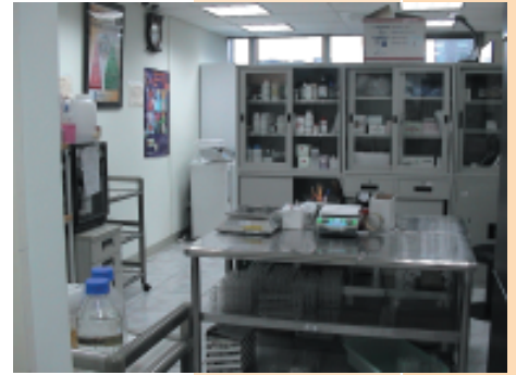
成立微生物檢驗室

藉由本公司於農、漁、牧、食品及生技產品之微生物檢驗專業技術，架構符合國際標準之微生物測試檢驗技術及品質管理系統，並與國外相關生物領域能力試驗機構相互比對，取得國外及國內中華民國實驗室認證體系(Chinese National Laboratory Accreditation, 簡稱 CNLA)之生物領域能力試驗機構認證。再根據國內相關產業需求，架構微生物檢驗測試平台，引進國際生物領域能力試驗機構之技術、資訊和管理模式，以輔導及協助農畜水產、食品、醫療和生技產品業者有效率的進行所需的生物領域能力試驗。