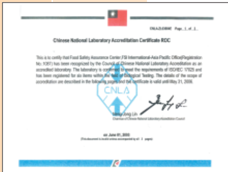
取得 CNLA 生物領域認證

透過能力試驗檢驗測試平台技術之開發與建立，可協助國內農、畜、水產、食品業、餐飲業、生技產品、醫療技術、研究機構、檢驗機構及其它有微生物檢驗需求單位等提供進行能力試驗測試比對所需資訊與服務，使國內業者不需再尋求國外能力試驗執行機構，以減少時間與費用之支出，也可與國際其他機構進行相互認證與實驗比對，使國內能力試驗之技術能與國際並駕齊驅。同時透過微生物檢驗方法與標準之架構，提供國內產業品質主管、檢驗人員專業之微生物品質保證操作訓練課程。此外亦可提供穩定且具國際水平之檢驗技術，提高國內產業檢驗之準確性，減少重複檢驗頻率，降低檢驗成品及人力投資，提昇國內產業產品品質，以符合國際要求，促進國內產品外銷，並藉由具公信力之檢測結果，增進公司業務。