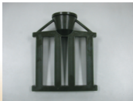
圖二：精密鑄造製程新模頭