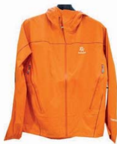
品牌商使用P4DRY技術加工織物-KAILAS透氣防水外套