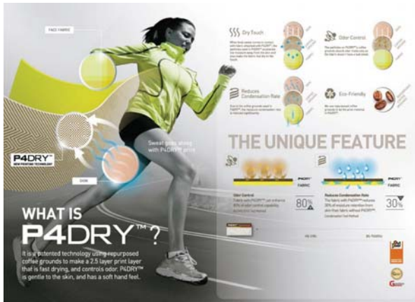
P4DRY技術加工產品簡介