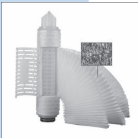
親水化 PTFE 濾心產品